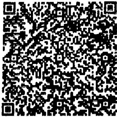
E建国的年检二维码